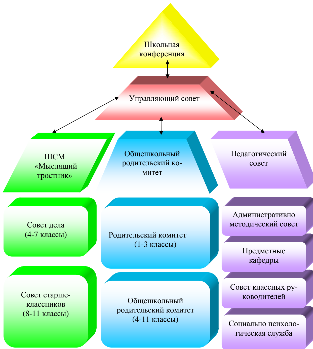
Схема управления воспитательной системой